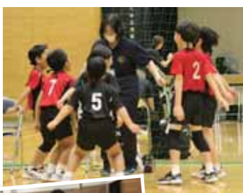
小学生バレーは26年、剣道はほぼ25年。学びの多い歲月。

昨年の秋頃から、私は右足を引きずり、手すりにもつかまるようになっていた。剣道の稽古はおろか、剣道形の足もでない。子供バレーのボール出しも骨がおれた。もはやアウト。来るべき時がきたのだ。長きに渡り続けられたことに感謝しよう。自分に言い聞かせ続けた。私は、股関節の手術で知られている近くの病院へ行くことにした。手術は避けたいが、このままでは悔いが残る。どうせアウトなら、全力を尽くして終わろう。