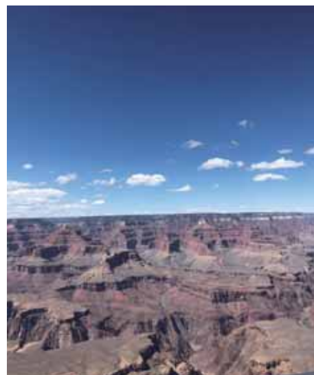
Grand Canyon (Arizona State)

現在、アリゾナ州(Phoenix)には多くの半導体企業・サプライチェーン企業が集中、州として米国の半導体中枢(Semiconductor HQ)となっており、半導体ファウンドリー(TSMC・Intel)を中心に欧米の半導体Chip生産拠点の一角を担っています。日本でいう「KIOXIA Rapidus、JASM(TSMC)がそ