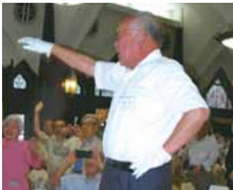
エールで母校と全員を応援