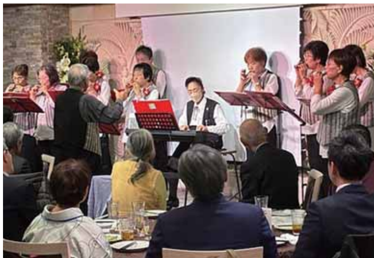
コカリナを演奏する小諸会の「りんどう会とその仲間たち」

11月8日に上野公園近くの会場で開 催され、小諸出身・小諸にゆかりのあ る方々が集いました。当日、小諸から バスで来られた「りんどう会とその仲