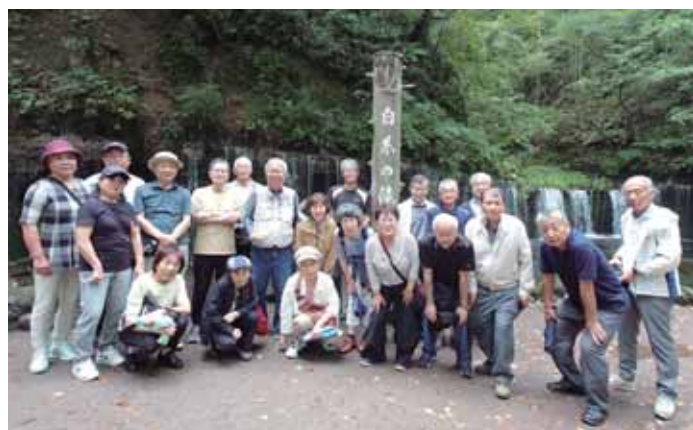
S43卒との恒例の集い(旅行)：軽井沢白糸の滝にて2025.9

伊那市に住む私は、岩高が初任校であつた縁で、今でも佐久の地を訪れる機会に恵まれています。和田峠を終え、笠取峠をくだる頃から、浅間山の雄姿が次第にその姿を露わにし、塩名田を過ぎ塚原辺りにさしかかると、かつての田園景観は一変。「佐久の今昔」を痛感しながらも、口ずさみたくなるのが「大浅岳」。そういえば、昨年（令和7）だけでも、担任（卒業学年）だった諸君らと恒例の親睦の旅（岩村田、軽井沢、草津方面）、陸軍伊那飛行場の本校があつた埼玉県熊谷市へ敢えて佐久を通過して調査、秋には2011年開館の軽井沢に千住博美術館での浅間山の絵画鑑賞といったぐあいでした。特に美術館では、私の心に沈静しながら、未だ消えない浅間山・「大浅岳」（以前は校歌であつたと「百年誌」は指摘）の持つ深さをもう少し別の面からも学びたいとの思いもあつて足が佐久に向いたのです。