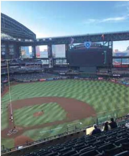
Chase Field (Diamond Backs)