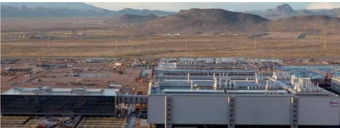
Around TSMC (Silicon Desert)

でもあったインターハイ出場を果たしてくれたソフトテニス班の後輩の成績を目にしました。『よく頑張った、よくやってくれた』と伝えたい気持ちです。 今の時代、運動部、文化部共に私立高校が良い結果を残すような傾向が見られます。スカウト、専門的な指導者、特化した授業体制など、システムが作られているので当然ともいえるのですが、結果を残すには、本人の努力だけでなく、家族のサポート、卒業生、顧問の方々のバックアップ、アドバイスがないとどうしても、うまくいかない、ということが多々あると感じます。このようなことを、現役時代も良く考えた記憶があります。「どうしたら効率よく練習ができるのだろう、強豪高校との試合に勝てるのだろう」と。部活動に限らずですが、迷ったときは、同窓会の諸先輩方々に相談することもお勧めします。経験と蓄積された知識が後押ししてくれると思います。 私自身、Arizonaに住していますが、現在も佐久テニス協会に所属し、テニスに関わり、多くの経験、知識を学んでいます。機会がありましたら、母校の班活動へ何かお役に立てばと考えています。そして今回の記事掲載の機会を与えていただいた東都岩高同窓