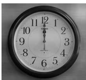
▲電波時計 ◀スタッキングチェアと台車