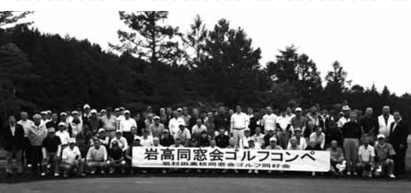
岩高同窓会ゴルフコンペ